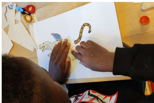
DR – Centre des monuments nationaux