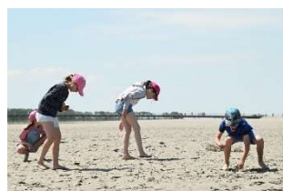
DR – Centre des monuments nationaux