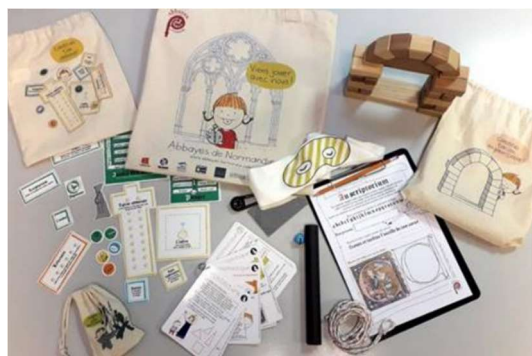
DR – Centre des monuments nationaux