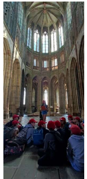
DR – Centre des monuments nationaux