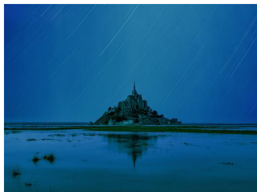
©Mont-Saint-Michel, grande marée nuit, 2023, Elger Esser - ADAGP