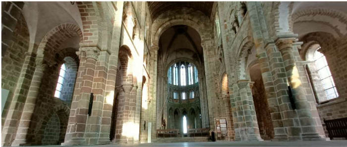
02. Eglise abbatiale, vue de la nef vers le chœur.