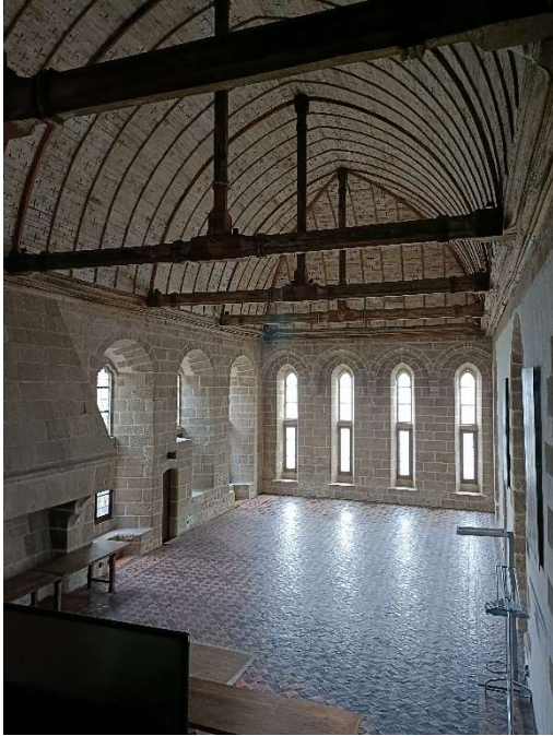
03. La salle Belle Chaise