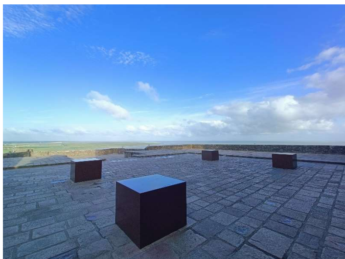
01. Terrasse de l'ouest, vue depuis la nef.